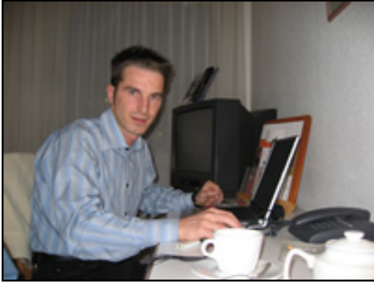
im Hotel in Hamburg September 2004